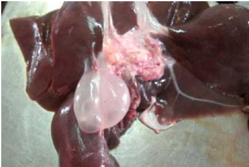
Fig. 2. Cisticercosis parasitaria en hígado