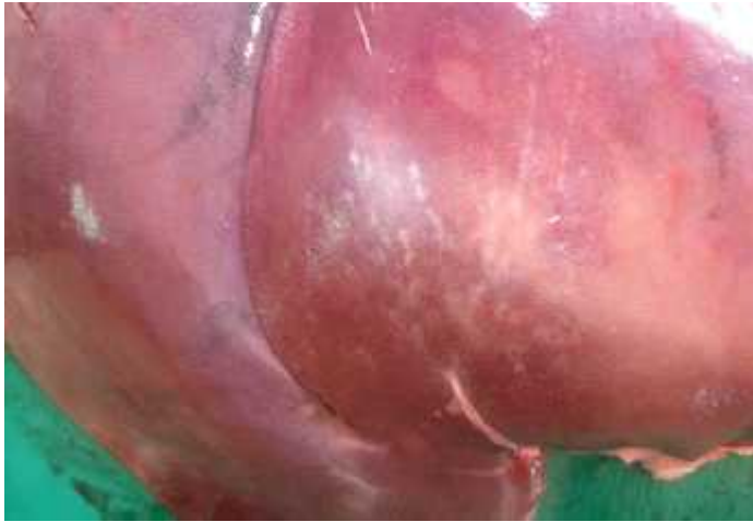
Fig. 1 Hígado con “manchas de leche” por migración parasitaria

El parasitismo renal está dado estefanurosis (Figs. 3 y 4), con cifras similares a los hallazgos de Ríos y Solís (2010) en Nicaragua.