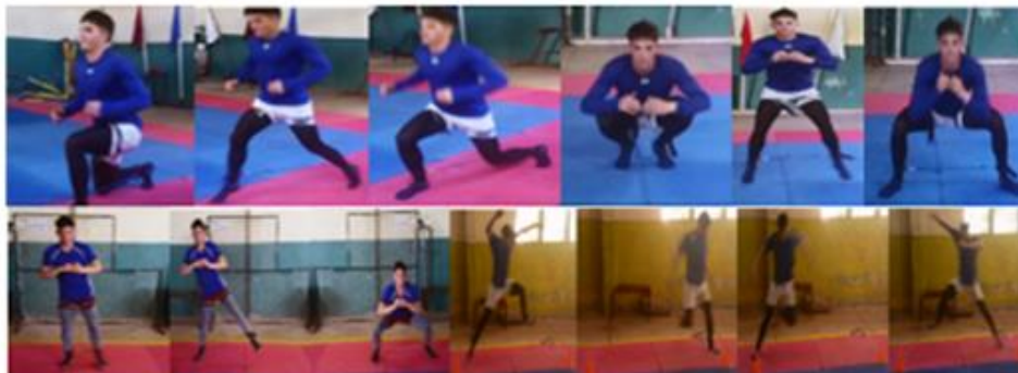
Fig. 4. Secuencia de ejercicios que incorpora tijera al frente con saltillo intermedio, salto en profundidad con piernas unidas y piernas separadas, desplazamiento con cuclillas con las piernas separadas y saltos laterales unilaterales con bandas elásticas de resistencia, amarillas en los muslos y azules en los tobillos.