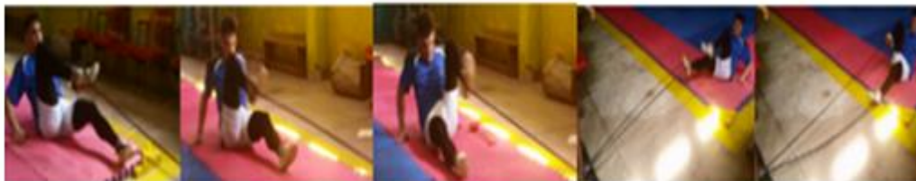
Fig. 2. Flexiones de rodilla con bandas elásticas azules de resistencia.

El porcentaje de elongación para un ejercicio realizado sobre varias articulaciones se determina por la amplitud del movimiento, realizado a 90 grados (100% de elongación) con un tubo Thera-Band color azul, el índice de fuerza será entre 43-71(kilogramos de resistencia) cuando se emplean de 6-10 repeticiones y entre 59-85 (kilogramos de resistencia) cuando se emplean de 8-12 repeticiones Page y otros., (2000).