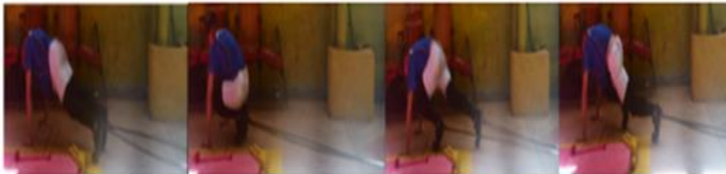
Fig. 3. Cuadrúpeda con flexión y extensión de piernas unilaterales y bilaterales con bandas elásticas negras de resistencia en los tobillos.