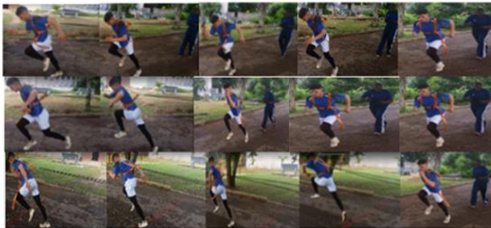
Fig. 6. Ejercicios de carrera, elevando muslos con bandas elásticas de resistencia y terminal en carrera de velocidad, salto alterno con bandas elásticas de resistencia terminal en carrera de velocidad y carrera de velocidad con bandas elásticas de resistencia.

resistencia) cuando se emplean de 12-15 repeticiones, Page y otros., (2000).