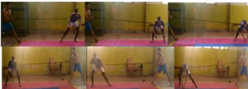
Fig. 5. Desplazamientos laterales con bandas elásticas negras de resistencia.