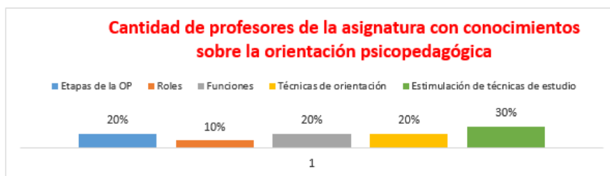
Fig. 1 - Resultados de la entrevista grupal a profesores de la asignatura Español básico

Se presenta la caracterización del proceso de orientación psicopedagógica en la asignatura Español básico en la carrera de Cultura Física del CPE en la Universidad de Pinar del Río "Hermanos Saíz Montes de Oca" a partir del comportamiento de cada instrumento aplicado. Durante la entrevista a profesores acerca del conocimiento sobre el proceso de orientación psicopedagógica de forma general no conocen las particularidades (Figura 1).