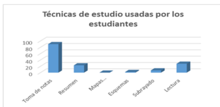
Fig. 3 - Resultados de la encuesta realizada a los estudiantes

En la encuesta, los estudiantes refirieron que desconocen el uso de técnicas de estudio (Figura 3).