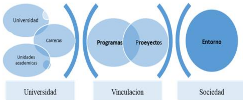
Fig. 1. - Articulación de los proyectos de vinculación con la sociedad

En el contexto de la educación universitaria, la vinculación con la sociedad es una función esencial del sistema educativo de este nivel, y está armonizado con la investigación y la docencia fundamentando así los pilares de la academia (Rodríguez, et al., 2018), con ello se da fe del "compromiso y la pertinencia de las instituciones de educación superior con las necesidades sociales actuales y con los perfiles relacionados con el profesional en formación" (Brito-Gaona et al., 2018) (Figura 1).