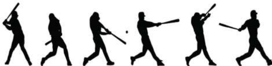
Fig. 1. - Secuencia completa del fundamento bateo

Un importante razonamiento en la enseñanza los escolares de Arronte (2022) va dirigido a que estos deben ser capaces de atacar con la rodilla trasera incluso antes de girar el pie trasero. Por lo general, en observaciones realizadas los escolares antes de girar, primero atacan, se impulsan con la rodilla trasera y esto trae consigo que el impacto, sin dudas sea mayor porque la inercia es superior y la mecánica inicial de movimiento y el impacto con la bola también va a mejorar.