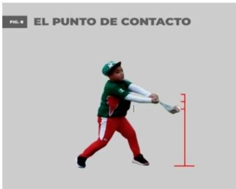
Fig. 4. - El punto de contacto

Como resultado de observaciones a clases, reuniones y entrevistas con los docentes deportivos de la escuela deportiva de Xalapa, relacionadas con el nivel de conocimientos de los fundamentos básicos del béisbol y su enseñanza, se detectaron las siguientes irregularidades: