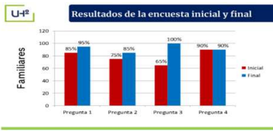
Fig. 5 - Tabulación de la encuesta a los familiares de los estudiantes preuniversitarios de la Eide

Los resultados finales obtenidos coinciden con los estudios de Carpio y Guerra (2017) que reconocen en las actividades relacionadas con la orientación vocacional un carácter metodológico, de superación e investigación orientadas a capacitar a los agentes educativos, de ahí que se justifica el contexto de la LCF y su incidencia en el proceso formativo de los estudiantes preuniversitarios de la Eide.