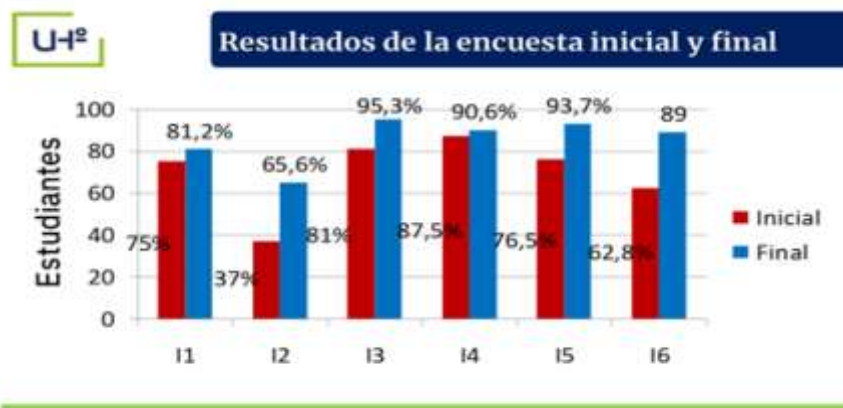
Fig. 3. - Tabulación de la encuesta inicial y final a los estudiantes

Por otra parte, los resultados de la encuesta final realizada a los estudiantes evidenciaron una mejoría relacionada con la vocación, intereses profesionales, las metas trazadas y los objetivos profesionales de carácter inmediato, además de mostrar mayor seguridad en la selección de la LCF al estar más familiarizados con las particularidades de la misma; lo que significó un desarrollo de la vocación por la Carrera (Figura 3).