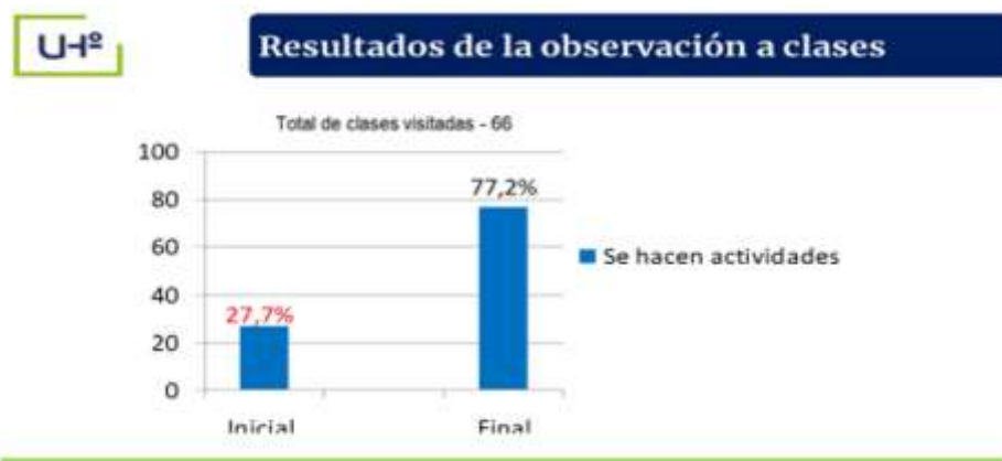
Fig. 2. - Tabulación inicial y final de clases y unidades de entrenamiento observadas

Por otra parte, los resultados de la encuesta final realizada a los estudiantes evidenciaron una mejoría relacionada con la vocación, intereses profesionales, las metas trazadas y los objetivos profesionales de carácter inmediato, además de mostrar mayor seguridad en la selección de la LCF al estar más familiarizados con las particularidades de la misma; lo que significó un desarrollo de la vocación por la Carrera (Figura 3).