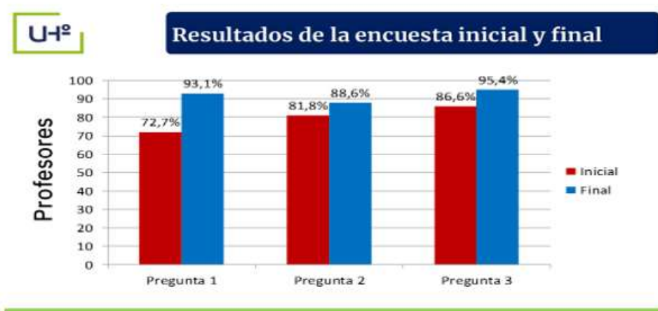
Fig. 4. - Tabulación de la encuesta inicial y final a los profesores de la Eide

curricular, extracurricular y sociopolítico, donde se establece el vínculo escuela, familia, comunidad que permiten el desarrollo de la vocación; la mayoría aprobó el contenido relacionado con el tratamiento a la orientación vocacional del estudiante preuniversitario hacia la LCF, en las preparaciones metodológicas a nivel de centro (Figura 4).