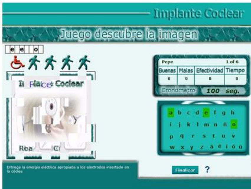
Fig. 4. Vista para selección de juegos

Otra funcionalidad es Juegos : a través de crucigramas y descubre la imagen los estudiantes pueden emular en sus conocimientos en el tema, ya que la multimedia permite la interacción de hasta 4 usuarios. En la figura 4 se muestra una vista del juego descubre la imagen.