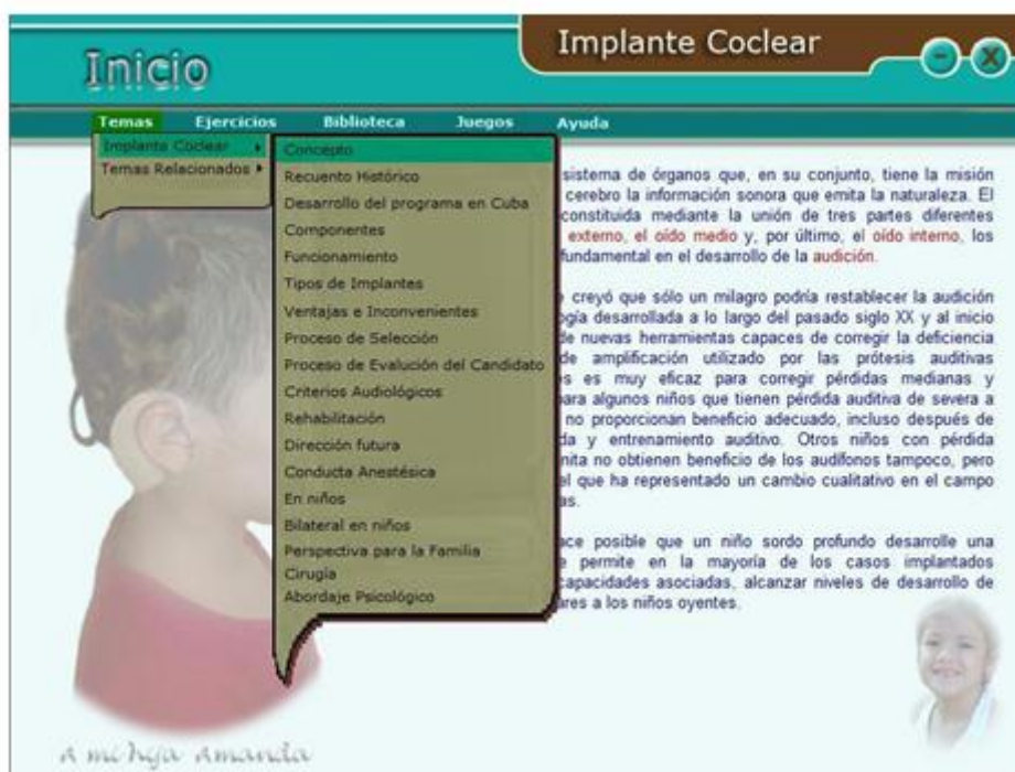
Fig. 1. Vista Inicial de la Multimedia.

La multimedia Implante Coclear cuenta con una interfaz sencilla, de fácil manejo, y contiene una ayuda que facilita su empleo a quienes la utilicen para conocer y ampliar conocimientos sobre el implante coclear. A partir del análisis de los requisitos funcionales que debía cumplir la multimedia, se diseñó una estructura para la navegación por ella como la mostrada en la figura 1. Como se aprecia, la multimedia cuenta con 5 funcionalidades principales: temas, ejercicios, biblioteca, juegos y ayuda.