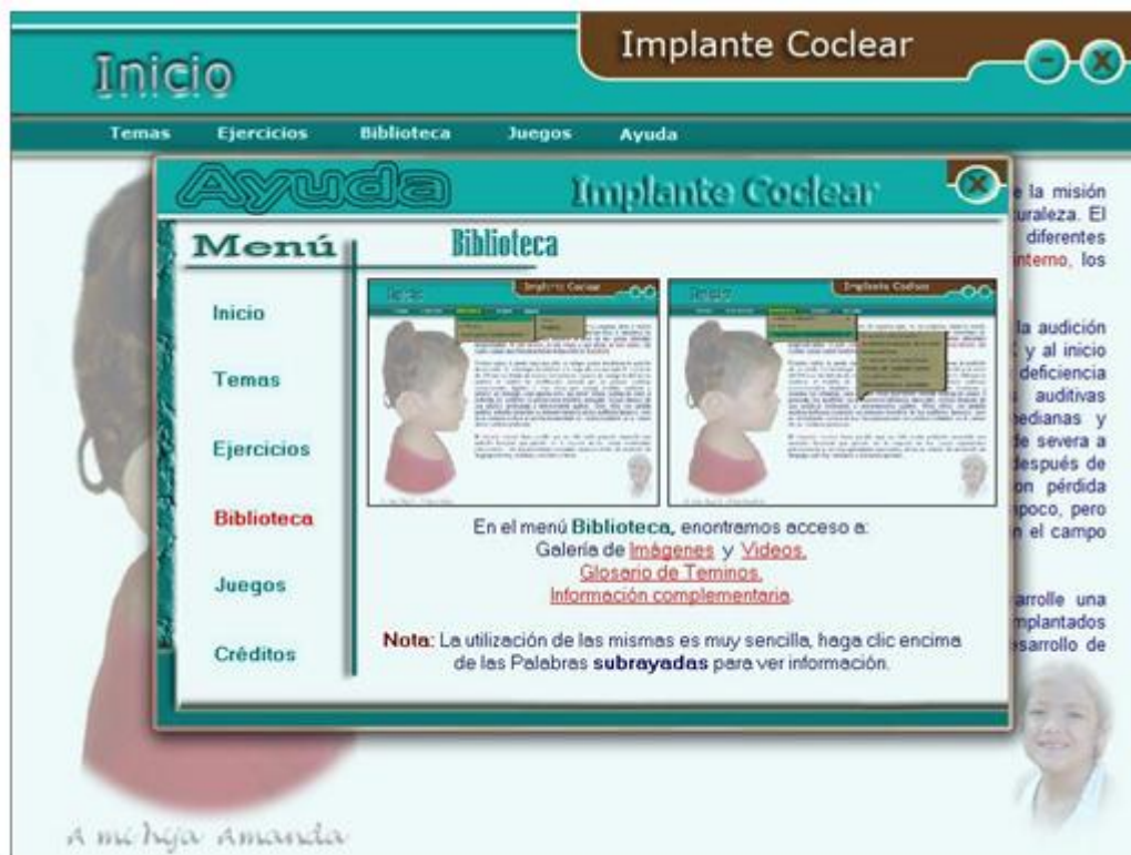
Fig. 5. Ayuda de Biblioteca.

Como resultado de la investigación realizada en el campo de la enseñanza-aprendizaje en los temas de implante coclear, se ha logrado implementar una multimedia interactiva y funcional, como producto de alta calidad, que contribuye a hacer más eficiente el aprendizaje.