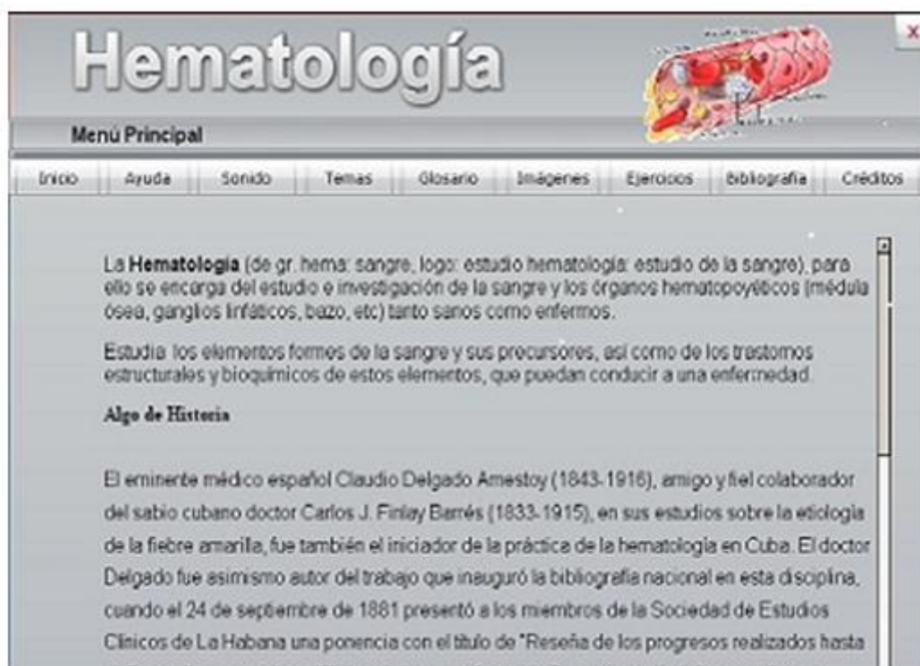
Fig. 1. Menú principal. Software de Hematología.

La organización de los contenidos se corresponde con el programa de la asignatura, de manera que, se distribuyen en los subtemas, y la secuencia de estudio es lineal. Permite al estudiante regresar a un contenido determinado dentro de un subtema. (figura 2)