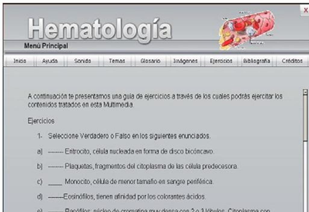
Fig. 4. Ejemplo de una guía de ejercicios.

Está elaborada en un lenguaje claro, sencillo y fácil de entender por el estudiante. La interfaz del usuario es amigable y sencilla, permitiendo que el estudiante pueda asimilar su utilización sin necesidad de manuales o sistemas de ayuda. De forma general, contiene colores claros para los fondos de pantalla y oscuros para los textos, creando un contraste atractivo que facilita la visualización de los contenidos.