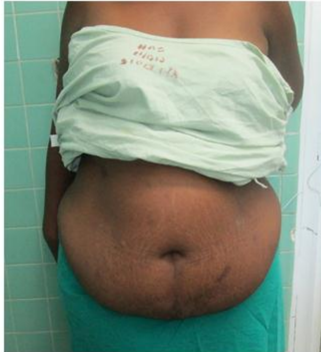
Fig. 1. Paciente después de la reducción de peso.