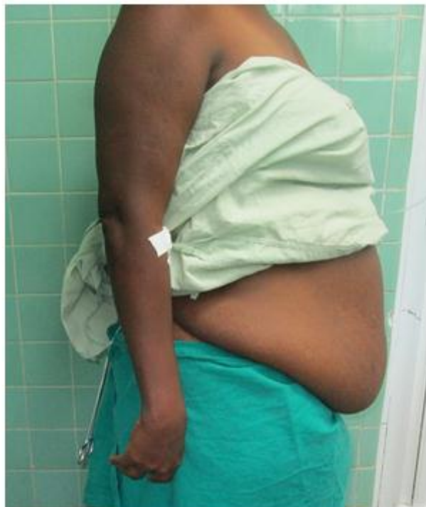
Fig. 2. Paciente después de la reducción de peso.

Se realizó técnica de Pitanguy (Figura 3, 4): incisión infraumbilical, levantamiento de colgajo hasta parrillas costales, plicatura de rectos abdominales, tracción, retirado excedente cutáneo, neoformación de ombligo, se afronta por planos y se coloca drenaje en abdomen.