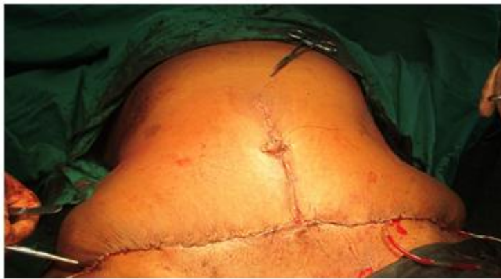
Fig. 4. Remodelación y sutura del colgajo.

A las 72 horas se retiraron los drenajes, y a los 14 días la sutura quirúrgica. La paciente no presentó complicaciones durante el transoperatorio ni en el postoperatorio inmediato y tardío. (Figura 5) Se mantuvo con baja rígida y vitaminoterapia durante 90 días, al cabo de este tiempo retomó el tratamiento alternativo y continúa reduciendo peso en espera de un segundo momento quirúrgico para remodelación corporal.