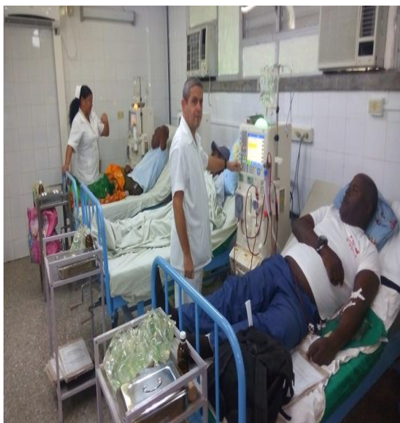
Imagen 2. Sala de hemodiálisis

El 29 de marzo del 2004 se inaugura la sala remodelada con excelentes condiciones físicas e higiene-epidemiológicas y de confort a enfermos, acompañantes y personal asistencial, con 22 riñones artificiales de última generación, tratamiento de agua por ósmosis inversa y local para el reúso de dializadores.