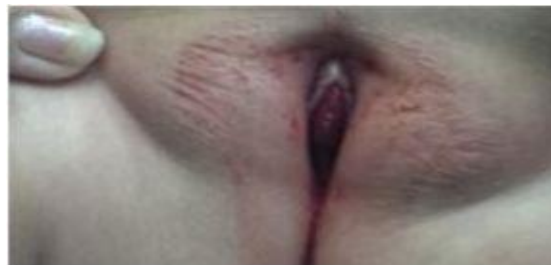
Figura 1. Presencia de sangre en introito y tumefacción visible.

velocidad de eritrosedimentación, a 35 mm/seg, además en el examen físico de la región perineal y en el tacto rectal se detectó la presencia de tumefacción palpable. (Fig. 1)