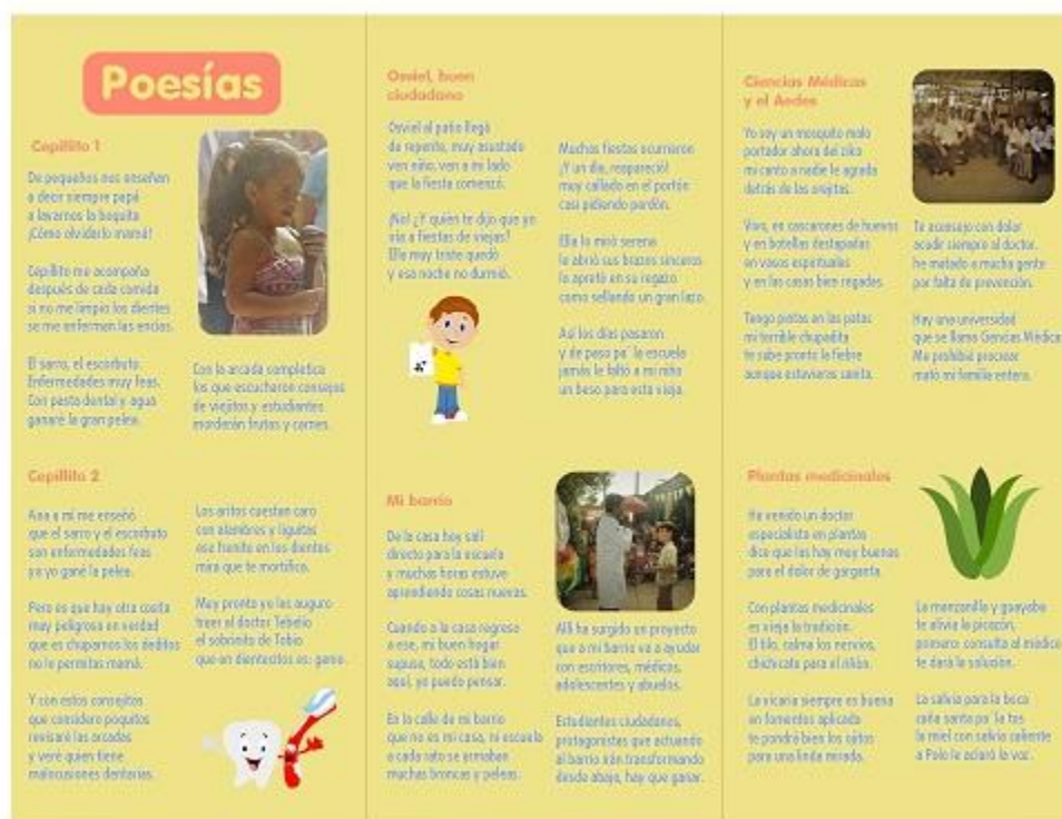
Fig. 2 Plegable "Poesías de la Cub-ANA". Páginas 2, 3 y 4.

Los usuarios de manera unánime emitieron excelentes criterios al valorar el producto, expresando que representa un modelo didáctico que satisface las necesidades educativas en un grupo de personas vulnerables a las influencias sociales, consideraron importante dicho plegable para forjar valores y conductas que debe poseer un buen ciudadano. Además de constituir un producto agradable, placentero, de fácil comprensión para todos los usuarios y de un relevante impacto social en la comunidad con favorable repercusión en sus pobladores.