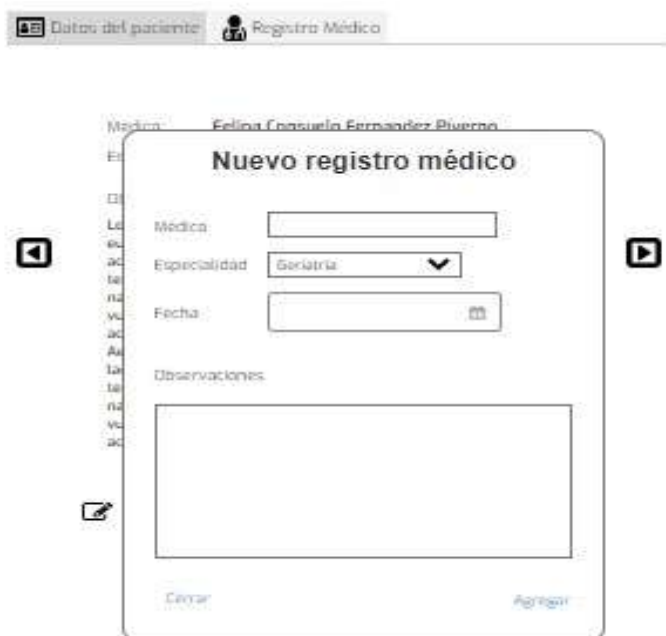
Figura 5. Registro de autenticación del médico

La aplicación permite que la estadística acceda a la interfaz y puede visualizar los egresos que hay y de ellos cuales pueden ser vivos o fallecidos, además del control de los ingresos con todos sus datos además de la sala, cama, en caso de egreso ya sea vivos o fallecido pues se dará clic en el cestico que se encuentra a la derecha y se puede eliminar de nuestros controles en las salas y podemos pasar la página en los botoncitos pequeños en la parte inferior a la derecha y a la izquierda como lo deseemos y si damos clic en las flechas de los extremos inferiores pues no llevan al principio o al final del registro. Como se visualiza en la (Figura 6).