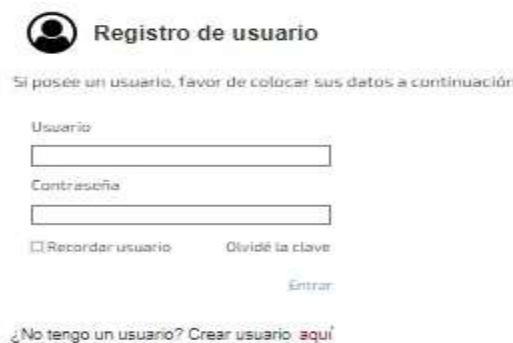
Fig. 4 Registro de Usuario para acceder a la aplicación

Al acceder al registro de usuario de la aplicación colocamos los datos del usuario y la contraseña para poder realizar el ingreso del anciano, pero podemos modificar si fuera necesario, así como la opción de crear una nueva historia clínica. (Figura 4)