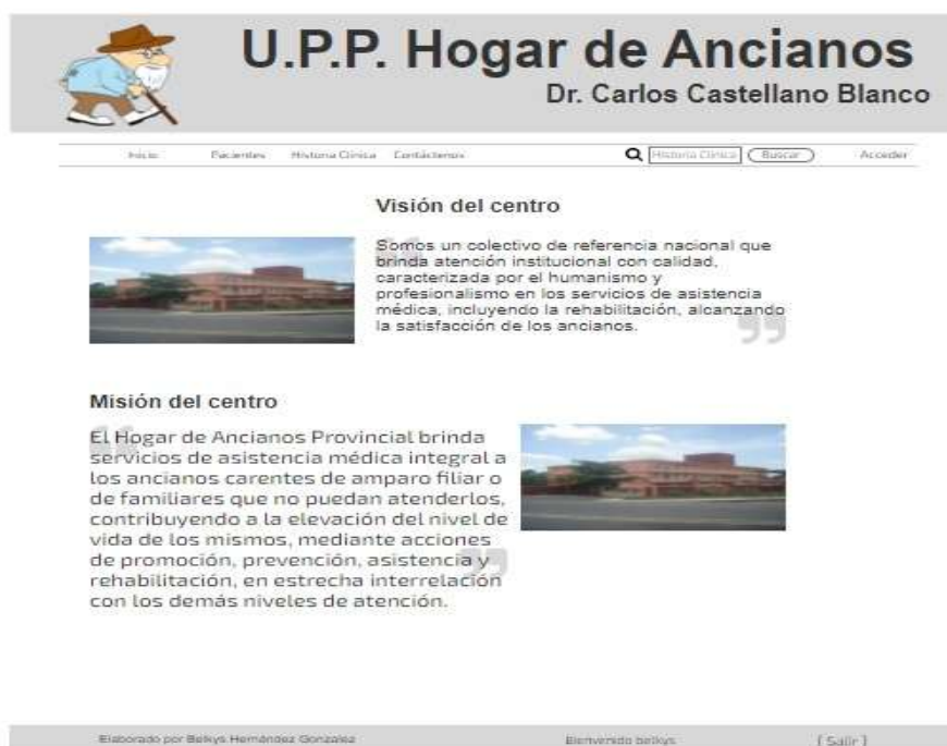
Fig. 3 Portada de la aplicación del Hogar de Ancianos

Al acceder al registro de usuario de la aplicación colocamos los datos del usuario y la contraseña para poder realizar el ingreso del anciano, pero podemos modificar si fuera necesario, así como la opción de crear una nueva historia clínica. (Figura 4)