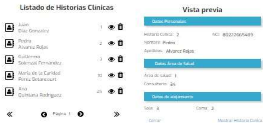
Fig. 6 Listado del Registro de Historias Clínicas

La aplicación permite que la estadística acceda a la interfaz y puede visualizar los egresos que hay y de ellos cuales pueden ser vivos o fallecidos, además del control de los ingresos con todos sus datos además de la sala, cama, en caso de egreso ya sea vivos o fallecido pues se dará clic en el cestico que se encuentra a la derecha y se puede eliminar de nuestros controles en las salas y podemos pasar la página en los botoncitos pequeños en la parte inferior a la derecha y a la izquierda como lo deseemos y si damos clic en las flechas de los extremos inferiores pues no llevan al principio o al final del registro. Como se visualiza en la (Figura 6).