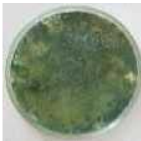
FIGURA 2.1. Competencia por el sustrato en el Cultivo Dual de Sarocladium S.o-4./ Competence for the substrate in dual crop of Sarocladium (S.o-4).

to de Trichoderma T. 1, que logró parasitar por completo al aislado S.o-4 en la evaluación final. La disminución de la colonia del patógeno en estos casos, concuerda con lo notificado por Vinale et al. (2) y Rey et al. (8) cuando plantearon que la degradación de la pared celular de los fitopatógenos comienza por la acción de varios compuestos que pudieran tener efecto sinérgico, así como de varios mecanismos que interactúan (9) y permiten la penetración del agente biocontrolador, provocando la vacuolización, lisis de las hifas y desintegración del patógeno.