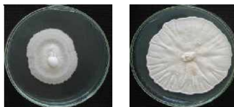
FIGURA 1. Diferencias culturales en las colonias de S. oryzae ( S. o-2 izquierda y S. o-4 derecha) a los siete días de cultivo. / Cultural differences between S. oryzae colonies (Left : S. o-2 , right: S. o-4 ) after seven days of growth.

La eficacia de los aislamientos de Trichoderma se determinó por el tipo de antagonismo en los cultivos duales (CD) con S. oryzae . Los dos hongos