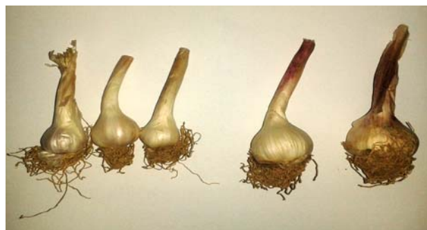
FIGURA 2. Comparación del tamaño de los bulbos de ajo presentes en los campos muestreados. A la izquierda bulbos de plantas afectadas por roya y a la derecha bulbos de plantas sanas./ Comparison of garlic bulb size present in sampled fields. Right-rust affected plant bulbs and Left-healthy plant bulbs.

de las plantas afectadas presentaron un menor tamaño en comparación con plantas del mismo campo que permanecieron sanas (Figura 2).