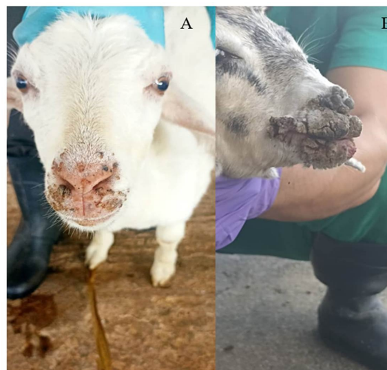
Figura 1. Lesiones compatibles con ectima contagioso en cabras infectadas con ORFV. A-B. Lesiones pustulosas y costras en boca, morro y comisura labial. / Lesions compatible with contagious ecthyma in ORFV-infected goats. A-B. Pustular lesions and scabs in the mouth, nose and labial commissure.

Se confirmó mediante PCR que el cuadro clínico observado en los animales se produjo por el ORFV, lo que constituye la primera evidencia molecular de este virus en Cuba.