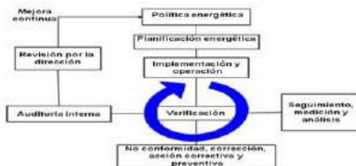
Fig.1 Modelo del SGen según la NC-ISO 50001:2011.

Para lograrlo plantea el modelo reflejado en la figura 1