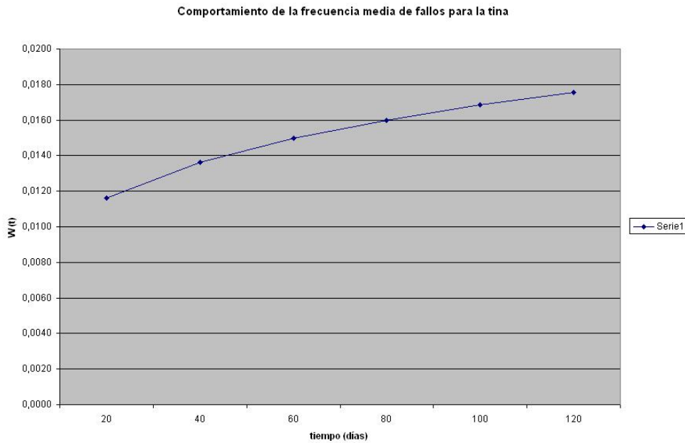
Fig. 1 Comportamiento de la frecuencia media de fallos W(t) (1/d) para el mezclador-sedimentador, (tina) en el proceso de elaboración del mosto.