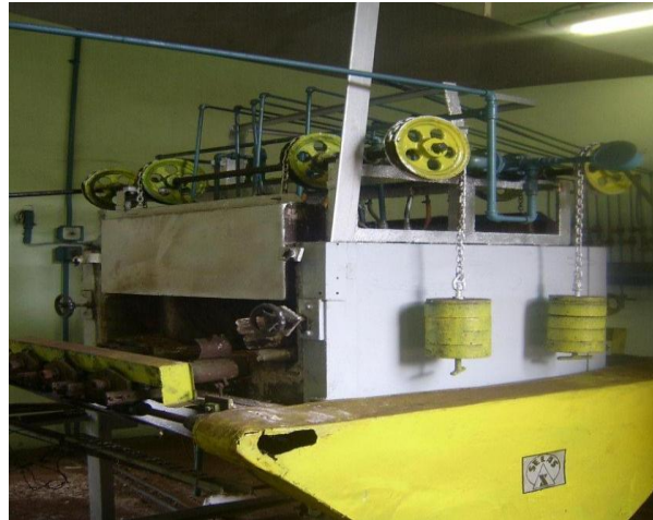
Fig. 1- Instalación empleada para la experimentación. Horno Selas

En cada botella se suministró 700 g de mineral, las muestras fueron procesadas a una temperatura de 750 °C y un tiempo de retención a la temperatura máxima de 10 minutos, luego se enfriaron hasta 100 °C dentro de la botella y fueron extraídas en atmósfera inerte con argón hacia un kitazato, recipiente hermético que contiene también argón para evitar la reoxidación del mineral.