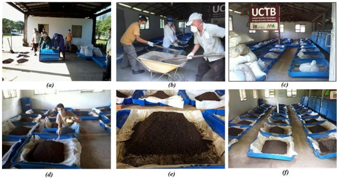
Fig. 3- Imágenes de las etapas de montaje de las unidades experimentales.