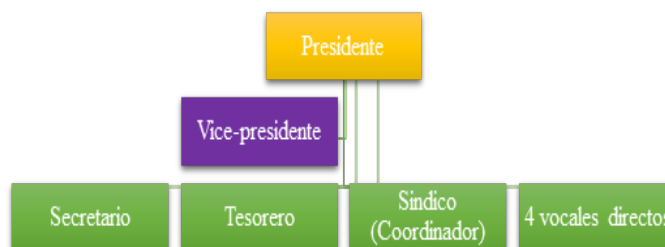
Figura 2. Organigrama administrativo de la comunidad.

La directiva comunitaria de la comuna Palacio Real está conformada por un Presidente, el cual bajo la opinión y participación de los miembros de la comunidad toma las decisiones apropiadas para beneficio de la población. La directiva de la comunidad se elige al inicio de cada año y está constituida por nueve personas que son elegidas por todos los miembros de la comunidad de 18 años en adelante, tal como lo muestra el siguiente organigrama (figura 2):