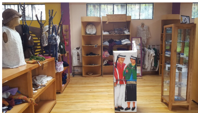
Figura 6. Centro de Artesanías.

Las mujeres de la organización Nuevo Milenio ofrecen a los turistas tanto extranjeros como nacionales, productos elaborados con fibra e hilo de llamas, los mismos que son exhibidos en el Centro de Artesanías del centro de turismo comunitario; entre los artículos que se pueden encontrar están: gorros, chales, bufandas, guantes, ponchos, abrigos, sombreros, cinturones, carteras, billeteras, bisuterías e incluso ropa para bebé (figura 6).