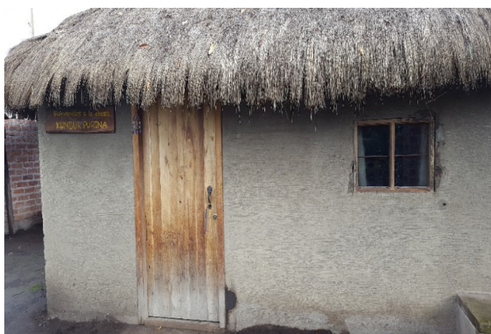
Figura 4. Chozas Purina.

En lo que respecta al alojamiento, varios habitantes de la comunidad Palacio Real disponen de chozas extras en sus viviendas, las mismas que han sido adecuadas para dar alojamiento y alimentación a los turistas que llegan a esta comunidad, permitiéndoles también de esta manera, compartir y hacerlos parte de su forma de vida comunitaria (figura 4).