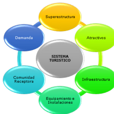
Figura 1. Sistema Turístico.

Se desarrolla el diagnóstico turístico de la comuna Palacio Real. Ricaurte (2009), menciona que “el diagnóstico establece una diferencia entre la condiciones del turismo antes y los resultados obtenidos después de la aplicación de acciones o estrategias dentro de la planificación turística en un destino” (p. 3). Razón por la cual se utilizara el Sistema turístico de Molina (1991), ya que en el asevera que este sistema está compuesto por diversos subsistemas que son (figura 1):