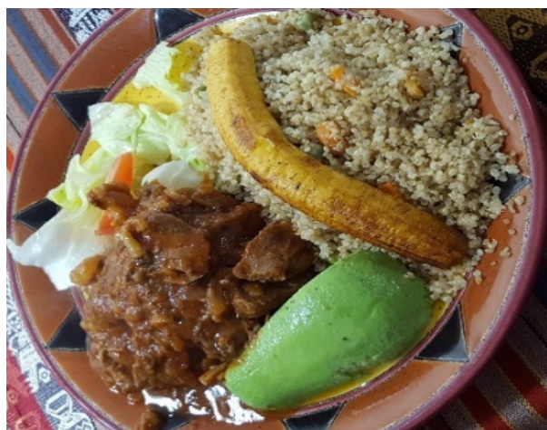
Figura 5. Plato de Carne de Llama al vino.

La especialidad de la casa es la fritada de llama, sin embargo, las mujeres a cargo del restaurante de comida típica "El Palacio de la Llama" preparan otros platos tales como carne de llama al vino o seco de llama, los mismos que son servidos con quinua, ensalada, maduro, aguacate, como acompañante un vaso de chicha de quinua o jora y como postre un crepé con sirope de chocolate (Figura 5).