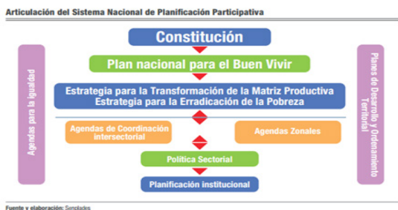
Figura 1. Modelo de Planificación Participativa.