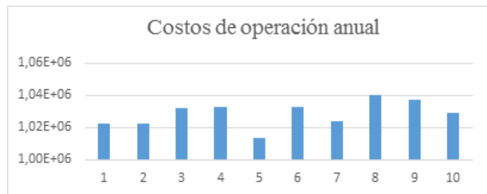
Figura 1. Costo de operación anual de la gestión integral de residuos sólidos urbanos.

ya que posee el mínimo costo, siendo bastante notable la diferencia en comparación con el resto de los escenarios planteados.