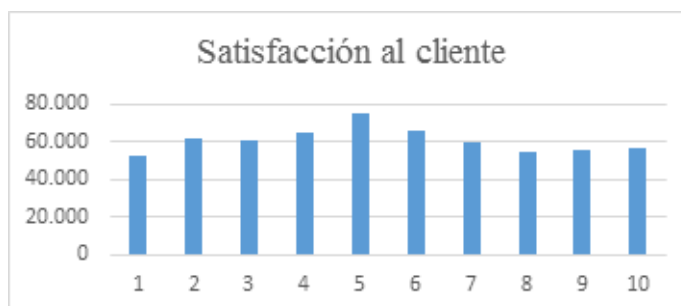
Figura 3. Satisfacción al cliente de la gestión integral de residuos sólidos urbanos.

Siguiendo con la comparación entre los escenarios planteados se observa la satisfacción al cliente, planteada como la maximización de los residuos sólidos recolectados y tratados tanto en el centro de tratamiento como en el centro de compostaje. Se puede ver de nuevo en la figura 3, que el escenario 5 sale favorecido ya que es el que posee un mayor valor de cantidad de residuos sólidos que se recolectan y son tratados en ambos centros.