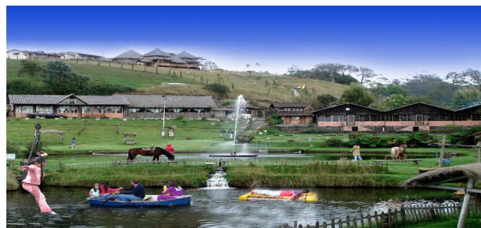
Figura 7. Imágenes de casos exitosos en la provincia Tungurahua.

La experiencia de esta entidad turística se manifiesta en: (1) Incorporación de la entidad a la Ruta turística del Tungurahua; (2) Vinculación al perfeccionamiento de la educación y vinculación con el desarrollo del turismo en las comunidades, (3) Diseño sostenible de la instalación, (4) Fortalecimiento de las tradiciones y valores culturales de la región (figura 7).