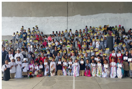
Figura 8. Naturaleza y diversidad (cría de peces)

El proceder seguido para la determinación de las actividades a desarrollar con las escuelas de la comunidad con el objetivo de vincular la teoría a la práctica en la enseñanza y la motivación por el desarrollo del turismo y el compromiso con la localidad resultó: (1) Estudio de los objetivos y contenidos a desarrollar en los niveles de cuarto, quinto y octavo, en las materias donde puedan vincular experiencias vivenciales a los contenidos que se imparten. Realizar resumen de objetivos y contenidos factibles; (2) Realizar levantamiento de las condiciones existentes en la entidad que hagan factible el aprendizaje vivencial; (3) Relacionar objetivos y contenidos con posibilidades reales de ejecución (existentes o factibles de desarrollar); realizar propuesta metodológica de ejecución y determinación de las actividades docentes a desarrollar; (4) Validación por parte de los docentes de la localidad por medio de una encuesta de la concordancia con la propuesta que se realiza; (5) Ejecución de las actividades con los estudiantes; (6) Evaluación de la satisfacción de los estudiantes por la actividad desarrollada (figuras 8 y 9).