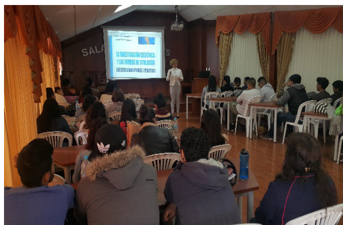
Figura 1. Imágenes sobre el desarrollo de los Seminarios.