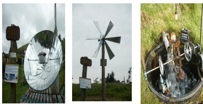
Figuras 10,11 y 12. Fuentes de energía renovables existentes: sol, aire y agua respectivamente.

El diseño de la instalación se caracteriza por el uso de la energía renovable. El suministro del agua para las áreas de crianza de peces se basa en un diseño en su totalidad con el aprovechamiento de la gravedad. Otras fuentes de energía renovables utilizadas como parte de la actividad de la instalación, a la vez que resultan de utilidad para la vinculación con la docencia se aprecian en las figuras 10,11 y12.