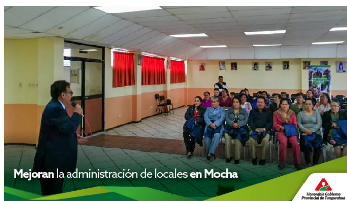
Figura 6. Evidencias del lanzamiento de programa de especialización turística.