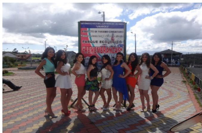
Figura 4. Evidencias del desarrollo de exposiciones.