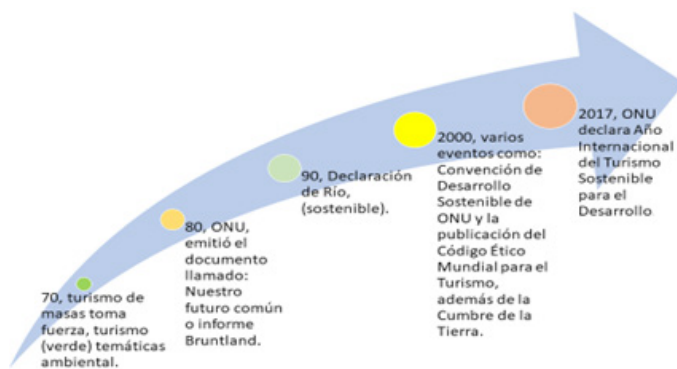
Figura 1. Del turismo de masas al turismo sostenible para el desarrollo.

Así, en el 2017, la Asamblea General de las Naciones Unidas, declaró al 2017 como el Año Internacional del Turismo Sostenible para el Desarrollo “Recordando así el potencial del turismo para ayudar a alcanzar la Agenda 2030 del Desarrollo Sostenible, de alcance universal, y sus 17 Objetivos de Desarrollo Sostenible (ODS)” (Organización de Naciones Unidas, 2012). Tal como se refleja en la figura 1.