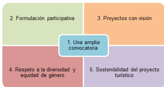
Figura 2. El turismo comunitario en América Latina. Directrices para articular los proyectos.

Pastor Jaime, et al. (2011), sostienen que: solo reconstituyendo el tejido local colectivo, en donde la solidaridad prime entre los proyectos comunitarios y donde prevalezca el respeto a individuos y colectividades, el éxito comunitario estará asegurado.