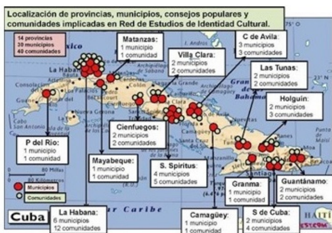
Figura 3. Implicación de la RED en lo local-comunitario.

Otros proyectos vinculados a la Red lograron involucrar a cientos de personas y decenas de colectivos e instituciones de 40 comunidades localizadas en 30 municipios de 14 provincias del país. La capacitación y preparación de los sujetos sociales en los territorios no solo estuvo dirigida a investigadores, estudiosos, promotores culturales, artistas, creadores, portadores de tradiciones culturales patrimoniales y decisores gubernamentales incluyó además las acciones dirigidas a una gama diversa de miembros de las comunidades (Figura 3).