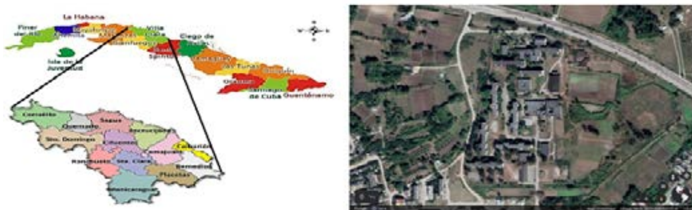
Figura 1. A la izquierda el mapa de Cuba con sus 15 provincias y el municipio especial Isla de la Juventud y mapa de la provincia de Villa Clara con sus municipios. A la izquierda: Foto satelital del Campus “Félix Varela Morales”.

La investigación se realizó en la Facultad de Educación Infantil, Departamento de Pedagogía - Psicología en el «Campus Félix Varela Morales», (Figura 1) de la Universidad Central «Marta Abreu» de Las Villas (UCLV), provincia Villa Clara, Cuba (Figura. 2) en las coordenadas 22.42327, -79,95781 (Atlas Nacional de Cuba, 2020).