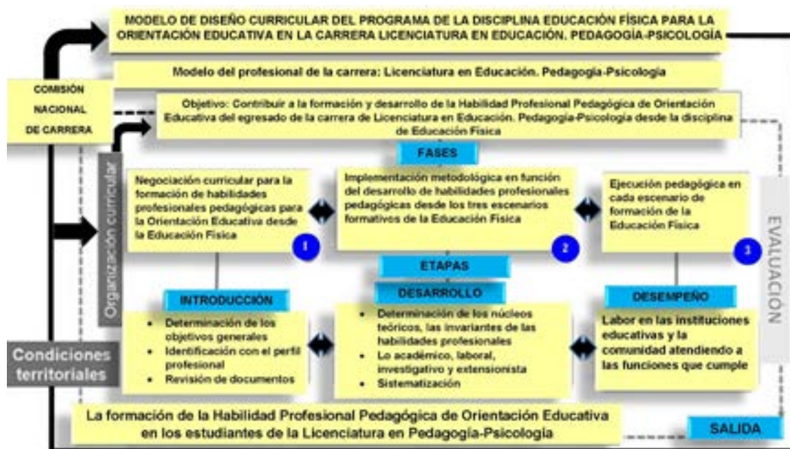
Figura 3. Modelo de diseño curricular del programa de la disciplina Educación Física para la Orientación educativa en la Carrera de Licenciatura en Educación, Pedagogía-Psicología.