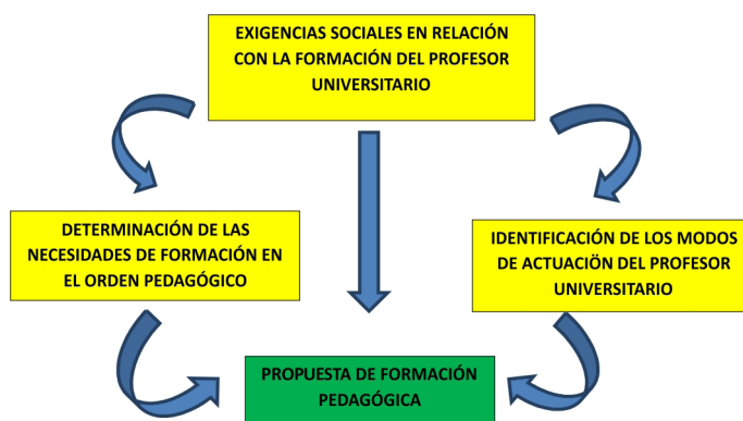
Figura 1. Sistema para la formación pedagógica de los profesores universitarios.

Como se aprecia, el concepto de necesidad es complejo, debe tenerse en cuenta de manera intencionada para proponer alternativas formativas a los profesores de la carrera, que luego de identificadas, tendrán carácter institucional, expresadas en normativas vigentes sobre el postgrado y sus formas en el Ecuador en general y en la Universidad de Guayaquil, en particular.