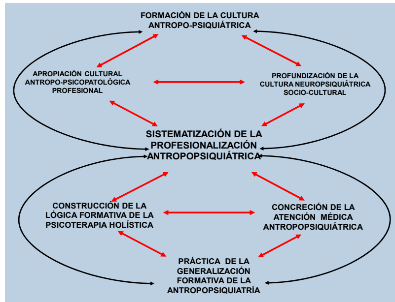
Figura 3. Modelo de la dinámica de la formación profesional antropopsiquiátrica