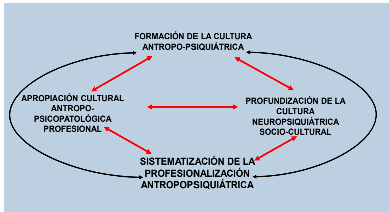
Figura 1. Dimensión antropopsiquiátrico sociocultural