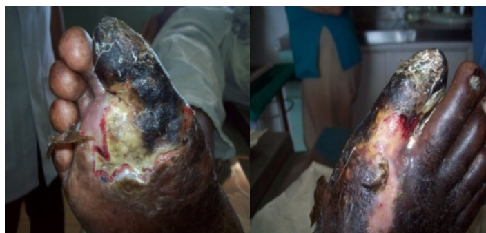
Fig. 1. Evolución antes del tratamiento con revascularización y Heberprot-P®