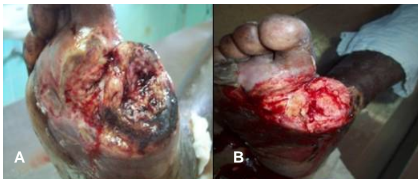
Fig. 3. A) Desarticulación del primer dedo del pie y primera aplicación de Heberprot-P®; B) Décima aplicación de Heberprot-P®

Este paciente recibió 12 aplicaciones Heberprot-P® y en solo 4 semanas se obtuvo un lecho totalmente útil, sin reacciones adversas al medicamento, de manera que quedó totalmente satisfecho con el tratamiento.