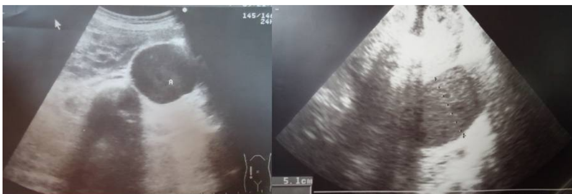
Fig. 1. Ecografía abdominal

- Ecocardiograma: septo: 8 mm; pared posterior: 6 mm; diámetro diastólico (VID): 50 mm; diámetro sistólico (VIS): 33 mm; aorta sinusal: 37 mm; aurícula izquierda: 20 mm; apertura aórtica (ApAo): 21 mm; fracción de eyección: 63,5 %; fracción de acortamiento (FA): 34,6 %; aorta ascendente tubular: 25 mm; arco aórtico: 22 mm; aorta descendente: 18 mm. Se observó insuficiencia aórtica trivial, valvulopatía septal de la mitral, marcadamente elongada, con mecanismos de prolapso y regurgitación trivial, así como aneurisma fusiforme de 47 mm en la aorta abdominal infrarrenal, con abundante contraste espontáneo en su interior (figura 2).