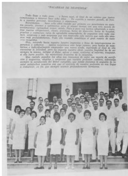
Fig. 2. Palabras de despedida

Ellos han cumplido el deseo expresado en "Las palabras de despedida" (figura 2): "Que cuando pasados los años nos reunamos, de entre esa mezcla de sacrificios y angustias, alegrías y sorpresas que nuestra profesión conlleva, sobresalga siempre la satisfacción del deber cumplido".