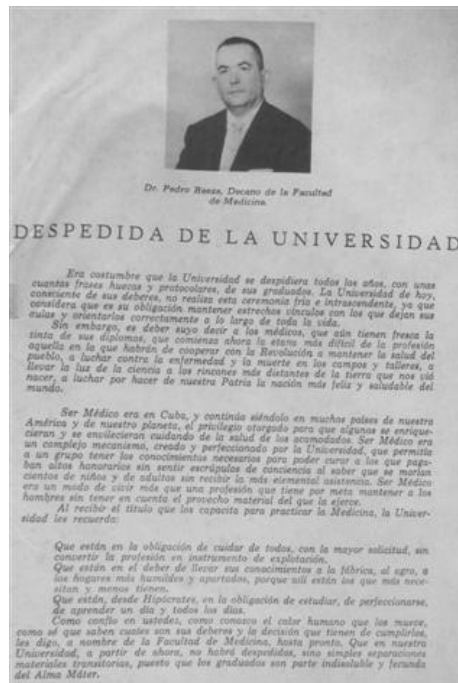
Fig. 3. Despedida de la Universidad

“Era costumbre que la Universidad se despidiera todos los años, con unas cuantas frases huecas y protocolares, de sus graduados. La Universidad de hoy, consciente de sus deberes, no realiza esta ceremonia fría e intrascendente, ya que considera que es su obligación mantener estrechos vínculos con los que dejan sus aulas y orientarlos correctamente a lo largo de toda la vida.