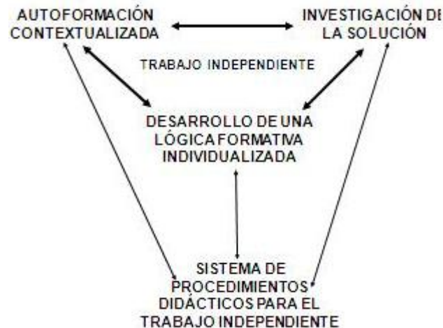
Fig.3. El trabajo independiente en la praxis hermenéutica

La relación dialéctica entre la autoformación contextualizada y la investigación de la solución es mediada en el desarrollo de una lógica formativa individualizada. Esta se constituye en la esencia del trabajo independiente de los estudiantes y significa que este se sustenta no en dar tareas que después se revisan, donde es común la repetición de trabajos anteriores o de lo dicho de antemano por el profesor. El trabajo independiente propicia espacios para que el estudiante se vea en la obligación de aportar respuestas sustentadas en la indagación y la argumentación (figura 3).