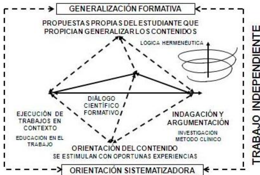
Fig. 2. El trabajo independiente en el proceso de enseñanza-aprendizaje

Lo anterior se resuelve en la realización del diálogo científico formativo que se desarrolla entre estudiantes y profesores en la orientación, cuando el estudiante tiene que sustentar sus propias propuestas que propician generalizar los contenidos y argumentar la novedad de sus resultados (figura 2).