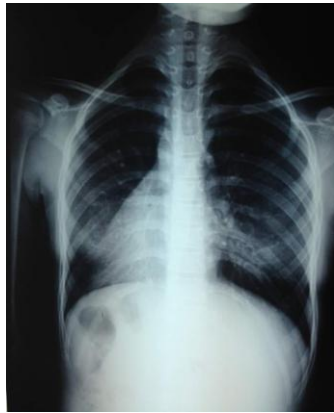
Fig.1. Radiografía de tórax con situs inversus y signos inflamatorios bilaterales.