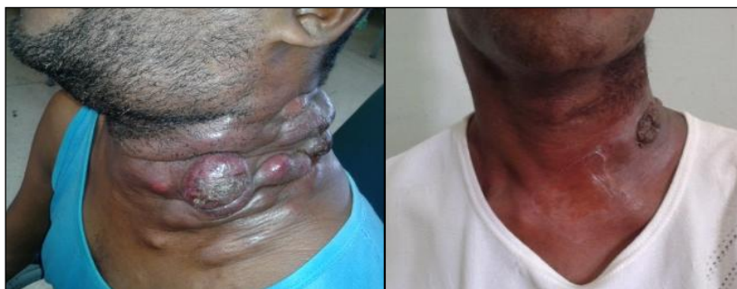
Fig 1. A) Aumento de volumen de la cadena ganglionar izquierda del cuello; B) Regresión de las adenopatías después de la quimioterapia y el reinicio de tratamiento antirretroviral.

También presentaba aumento de volumen en toda la región ganglionar anterior (figura 1A-B) e izquierda del cuello (edema en esclavina) y en la zona axilar anterior del mismo lado, de superficie lisa, consistencia dura, adherida a planos profundos y fluctuantes con tendencia a ulcerarse en la piel que lo recubría, parecido a una escrófula, con drenaje de material serohemático -- se denomina escrófula a un proceso infeccioso que afecta a los ganglios linfáticos (con frecuencia los del cuello), causado por el Mycobacterium tuberculosis (aunque en niños también puede deberse al Mycobacterium scrofulaceum o Mycobacterium avium ) --.