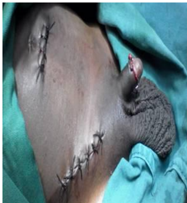
Fig.3. Hernias reparadas y circuncisión.

El período posoperatorio transcurrió sin complicaciones y el infante egresó de la institución a los 4 días de operado.