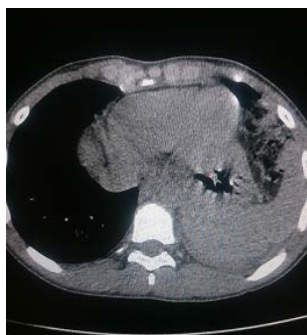
Fig.2 Presencia de bazo y colon en tórax

También se hizo laparotomía de urgencia y se encontró lesión en el hemidiafragma izquierdo de aproximadamente 10 cm de longitud (figura 3), con el estómago, bazo y colon herniado en el tórax. Se redujo el contenido herniado y se realizó frenorrafia con puntos separados, para lo cual se usó prolene 1; además, se hizo pleurostomía mínima baja izquierda.