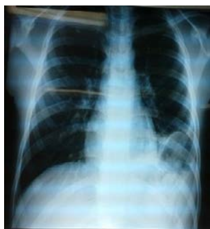
Fig.1 Imagen aérea en tórax

Ingresó en el Servicio de Cirugía y se notó incremento de la frecuencia respiratoria a 40 por minutos. A la auscultación se encontró en el 1/3 inferior hemitórax izquierdo, murmullo vesicular abolido y ruidos hidroaéreos. Se realizó nueva radiografía de tórax (figura 1) y se indicó tomografía simple de esa región (figura 2), las cuales confirmaron el diagnóstico clínico de HDT izquierda.