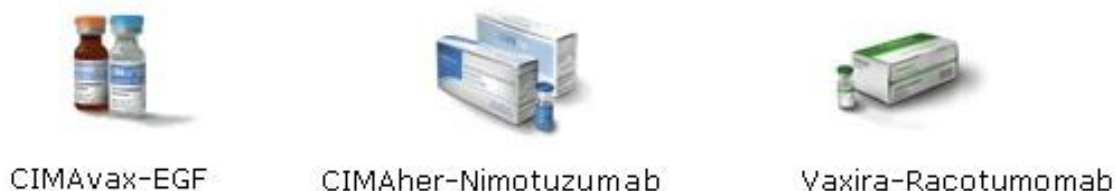
Fig.1. Productos inmunoterapéuticos aplicados

Los 3 productos inmunoterapéuticos aplicados fueron: CIMAhher-Nimotuzumab, CIMAvax-EGF y Vaxira-Racotumomab, a través de ensayos clínicos oncológicos (figura 1).