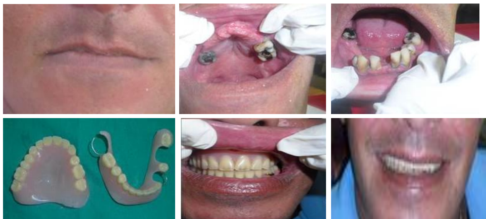
Fig. 1. Se muestra estado inicial del paciente, prótesis inmediatas terminadas e instaladas, así como las manchas nicotínicas en las dentaduras a la semana de instaladas.

Se presenta el caso clínico de un paciente de 48 años de edad, fumador, con antecedente de prótesis desajustada y deterioro de la estética. Al examen clínico se observó estado bucal séptico, por caries y sarro, acompañado de periodontitis y movilidad de grado III de dientes remanentes; también presentaba pérdida de la dimensión vertical, por lo cual fue diagnosticado como desdentado parcial, con sepsis bucal y afectación psíquica. Luego del análisis conservador se le realizaron las extracciones con alveoloplastia de dientes con caries insalvables y tejidos de sostén afectados, tartrectomía, obturaciones a dientes inferiores. Se instaló una prótesis total superior y una parcial acrílica inferior (figura 1).