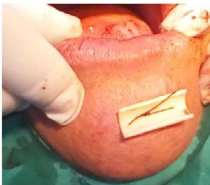
Fig. 2. Colocación del fragmento de sonda por fuera del labio