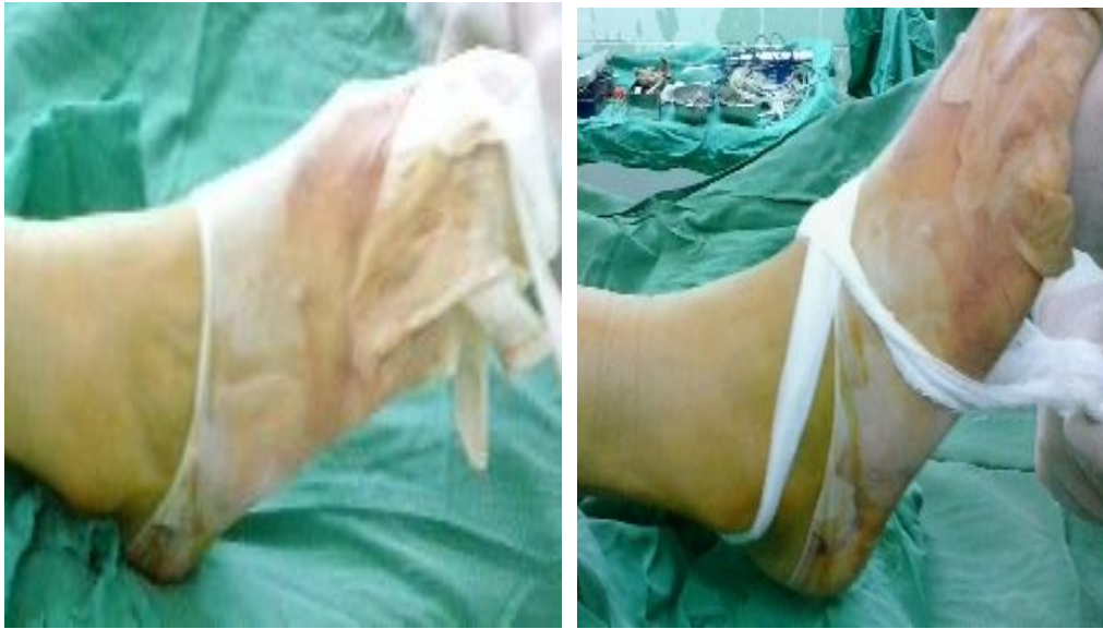
Fig. 1. Método de distracción no invasivo mediante asa de gasa

La distracción no invasiva es la modalidad más empleada y se lleva a cabo mediante un asa de tela o un vendaje (Fig.1.), que es aplicado en el tobillo en forma de ocho o no. Mediante este método y la aplicación de la gravedad se logra separar las superficies articulares del tobillo con menos complicaciones. Como plantea Frey C, (3) la tracción con 25 libras por un período de 30 minutos no se asocia con complicaciones.