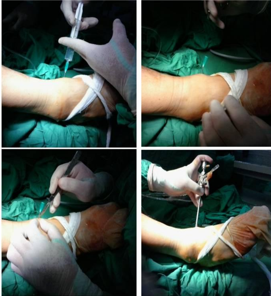
Fig. 3. Vía de acceso a través del portal artroscópico anteromedial