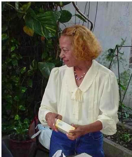
Fig. 3. En el patio de su amado Centro de Información

Aún le quedaron muchos proyectos por concluir, entre ellos su anhelado libro sobre redacción científica; siempre decía que por su afán perfeccionista no lograba terminarlo, mas nos atrevemos a pensar que la causa era otra: postergaba sus sueños para dedicar tiempo a convertir en realidad los de quienes le necesitaban.