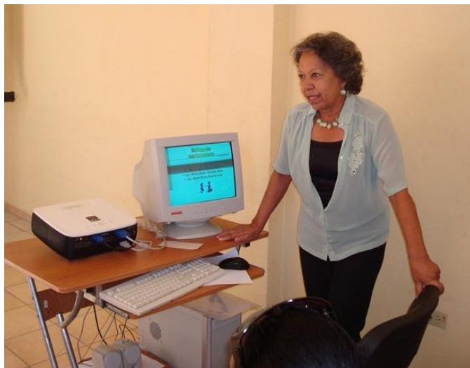
Fig. 2. Pronunciando una conferencia.

Durante años impartió temas relacionados con la redacción científica a profesionales de la salud: residentes, especialistas y doctores en ciencias de todos los hospitales municipales y provinciales; miembros de los consejos científicos de las facultades e instituciones asistenciales; cursistas de diplomados de especialización y predoctorales; especialistas de la Operación Milagro; miembros del Consejo Científico Provincial; futuros doctores en ciencias; en resumen, a todos aquellos que necesitaron su preciada contribución. Por muchos años fue docente en los cursos: