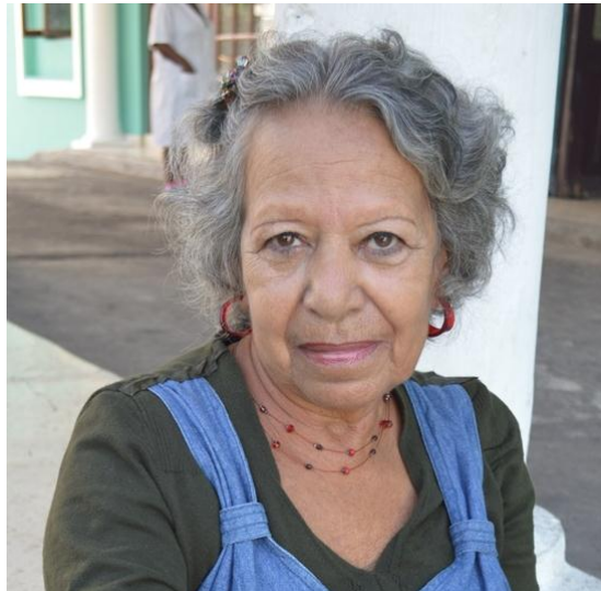
Fig. 5. Hasta pronto, querida Meja.