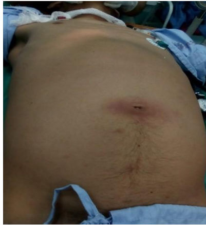
Fig. 1. Abdomen globuloso con signo de Cullen