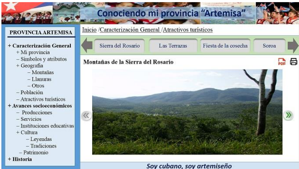
Figura 4. Información de los atractivos turísticos de la provincia desde el folleto electrónico.

En la figura 4 se muestra como acceder a la información de los atractivos turísticos de la provincia.