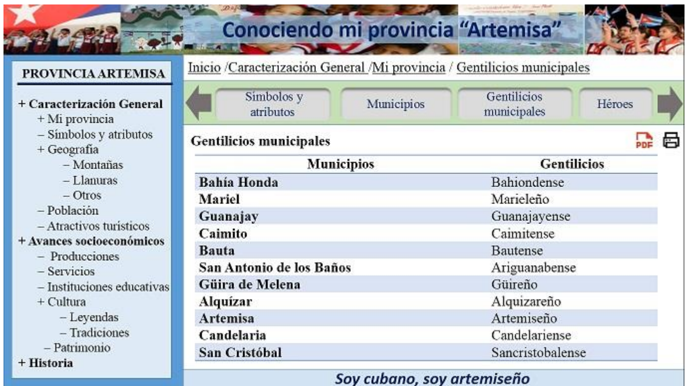
Figura 2. Gentilicios de los municipios artemiseños desde el folleto electrónico.

De manera, que el total de 48 municipios asentados desde Pinar del Río hasta la demarcación entre Mayabeque y Matanzas (cifra que representa el 28,5% del total nacional), quedaron distribuidos de la siguiente manera: 15 siguen perteneciendo a la provincia que en lo adelante retomó su topónimo natural (La Habana, antigua provincia de Ciudad de La Habana entre 1976-2010), en tanto las de Pinar del Río, Artemisa y Mayabeque cuentan cada una con 11. En la Figura 2 se muestra cómo acceder a los gentilicios de los 11 municipios de la provincia a través del folleto electrónico: