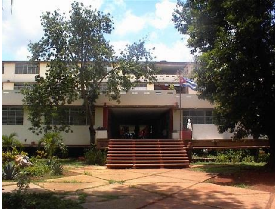
Figura 5. Escuela Pedagógica “Rubén Martínez Villena”, provincia Artemisa.

Las principales poblaciones fundadas en los actuales territorios que cubre la provincia fueron: Alquizar (1616), Guanajay (San Hilarión de Guanajay 1650). En el Siglo XVIII se fundaron las villas: San Cristóbal (1743), Bauta (Conocido como Hoyo Colorado 1750), Mariel (1768), San Antonio de los Baños (San Antonio Abad 1775) , junto al Río Ariguanabo, Guira de Melena (1779), Bahía Honda (1779). Además en el siglo XIX se fundaron: Candelaria (1810), Artemisa (1810), Caimito (1827).