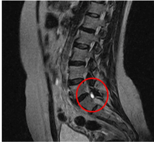
Fig. 1. RMN con corte sagital y axial ponderado en T1 que se puede observar imagen quística en la articulación facetaria L5-S1. (Vista A)