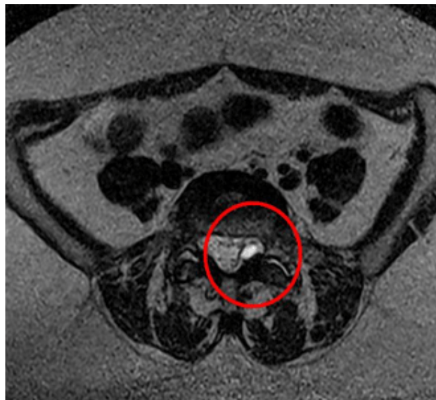
Fig. 2. RMN Con corte sagital y axial ponderado en T1 que se puede observar imagen quística en la articulación facetaria S1-L1. (Vista B)