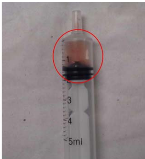
Fig. 4. Líquido sinovial de la faceta izquierda.

Se presentan imágenes evolutivas, luego de repetir la RMN de columna lumbosacra con igual técnica y se comprobó la desaparición del quiste facetario (Fig. 5).