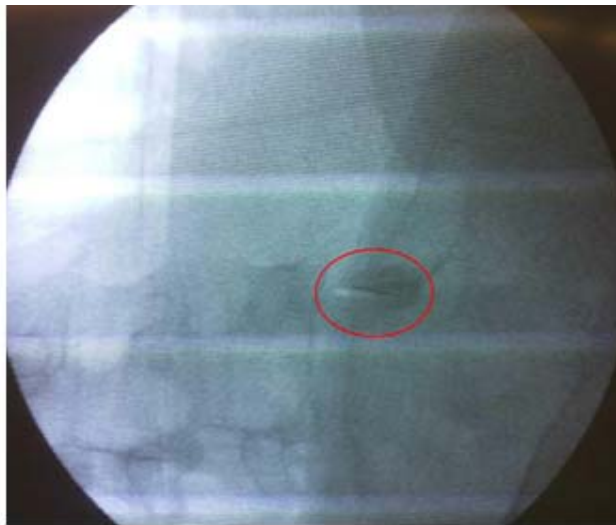
Fig. 3. Imagen fluoroscópica del quiste facetario ya infiltrado con ozono.

Se ubicó el espacio L5-S1 bajo visión fluoroscópica y se obtuvieron imágenes sin doble contorno vertebral ( Fig. 3 ). La mesa se colocó a 20 grados de lateralidad primero a la izquierda y luego al lado contralateral. Al encontrar la imagen del perrito escoses, se infiltró en la proyección de la articulación facetaria anestesia local: lidocaína al 0,5 %. Se introdujo trocar Chivas No. 22 hasta la articulación facetaria y se realizó aspiración de las articulaciones. Se obtuvo 1 mL de líquido espeso de color amarillento de la articulación facetaria izquierda ( Fig. 4 ) y ½ mL de la derecha, se le depositó 1mL de ozono al 45 % en cada una de las articulaciones y se obtuvo alivio inmediato del dolor.