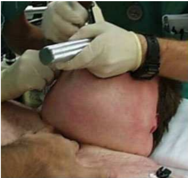
Fig. 1. Intubación en una embarazada.