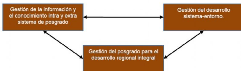
Figura 3. Subsistema de Gestión del regionalismo estratégico integrador de la educación posgraduada para el desarrollo regional.

Este subsistema está compuesto de dos componentes, el componente gestión de la información y el conocimiento intra y extra sistema de posgrado y el componente gestión del desarrollo del sistema-entorno. (Figura 3)