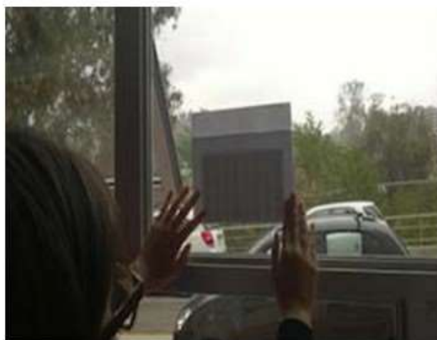
Figura 3: Manipulación del cuadrado de Shao Yong.

En la figura 3 se ve a una de las educadoras utilizando la metáfora del espejo o de la reflexión, en este caso el cuadrado es manipulado con diversos dobleces, lo que permite identificar un principio de computación de los hexagramas, al doblar a contra luz el cuadrado se ven todos "cerrados o completos" con ello se visualiza también la simetría del cuadrado y donde están ubicados los opuestos, principio por el cual se construye cada hexagrama.