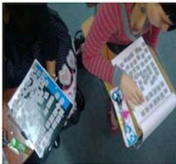
Figura 4: Trabajo con los 64 hexagramas del cuadrado de Shao Yong.

El trabajo que resulta desafiante para las estudiantes, es cuando reciben cada hexagrama por separado o se les pide que lo recorten y que luego vuelvan a armar el cuadrado, siguiendo algún patrón, ver figura 4. En estos casos, para lograr el desafío es necesario que se haya trabajado previamente las relaciones que hay entre los cuatro primeros hexagramas, que se haya llegado a una notación en ceros y unos, que se trabajen también los trigramas, de esta forma este último desafío logra ser más cercano y las educadoras en formación logran construir la metáfora del número posicional.