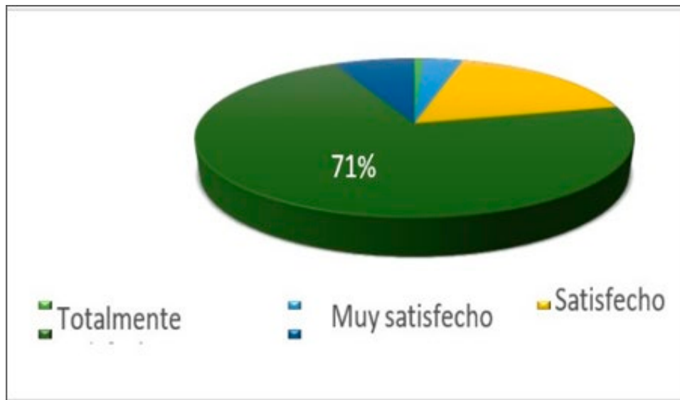
Gráfico 3 Satisfacción con el desarrollo de competencias orientacionales para el desarrollo de un aprendizaje significativo y una educación integral