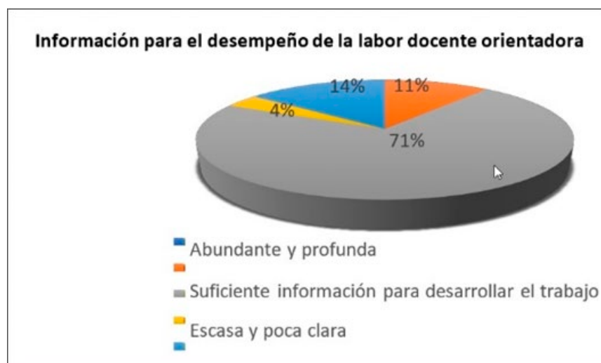
Gráfico 4 Posesión de conocimientos para orientar en técnicas de estudio