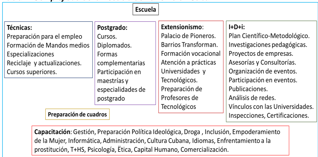
Tabla 1. Complejidad de la Escuela de Turismo en Cuba.

Para validar el resultado se aplicó el Método de expertos a una sola ronda y el Test de satisfacción grupal con la preparación recibida, sobre la base de la experiencia. Fue necesario además comprender la multiplicidad de direcciones de trabajo educativo e investigativo que desarrollan los Centros de Capacitación del Turismo, lo que se grafica a continuación. (Tabla1).